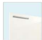
W: パナシェホワイト