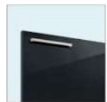
R: パナシェブラック