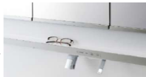
ちよい置きカウンター 手洗い・洗顔時にメガネや指輪などの一時置きに便利。