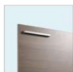
P: ミディアムウッドN