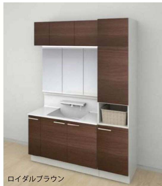
ロイダルブラウン

※画像は、洗面台本体 (W=1,200) + キャビネット (W=450) です。サイズは図面・仕様書にてご確認ください。